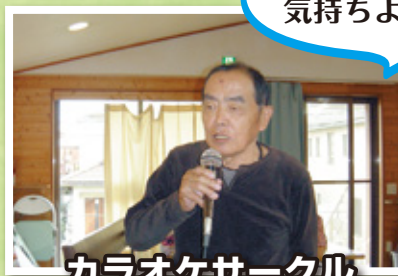
カラオケサークル