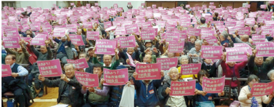
2018年11月25日 第32回日本高齢者大会in熱海における、止めよう!「9条改憲発議」「2割負担・後期高齢者の医療費自己負担」のアピールアクション