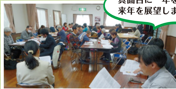
友の会総会・春のつどい(3月3日)