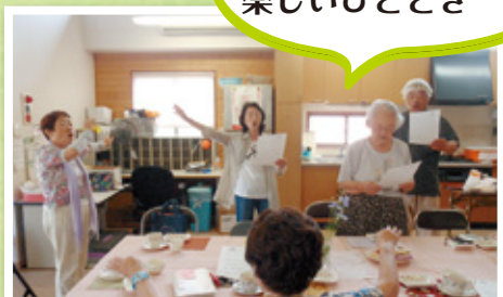
フラワーサロン(おしゃべり会)