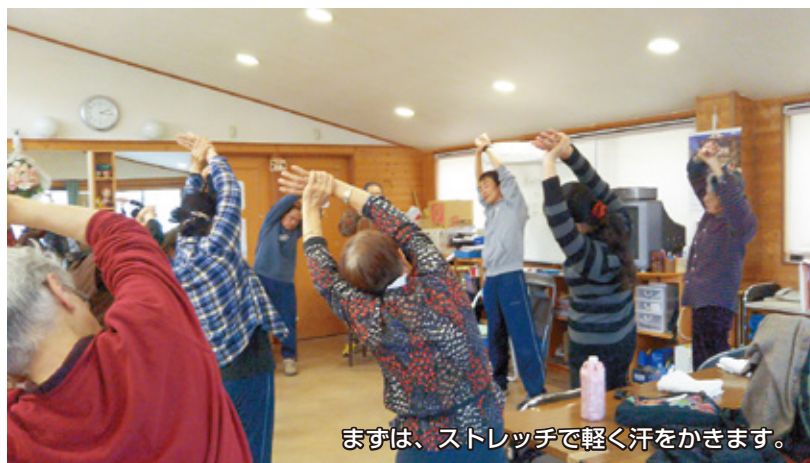
まずは、ストレッチで軽く汗をかきます。

内容はストレッチ体操、筋力トレーニング（自分の体重やタオルなどを使ったトレーニング）が中心で、ご自身の体調や、痛みの状況に合わせてながら参加できるような教室で