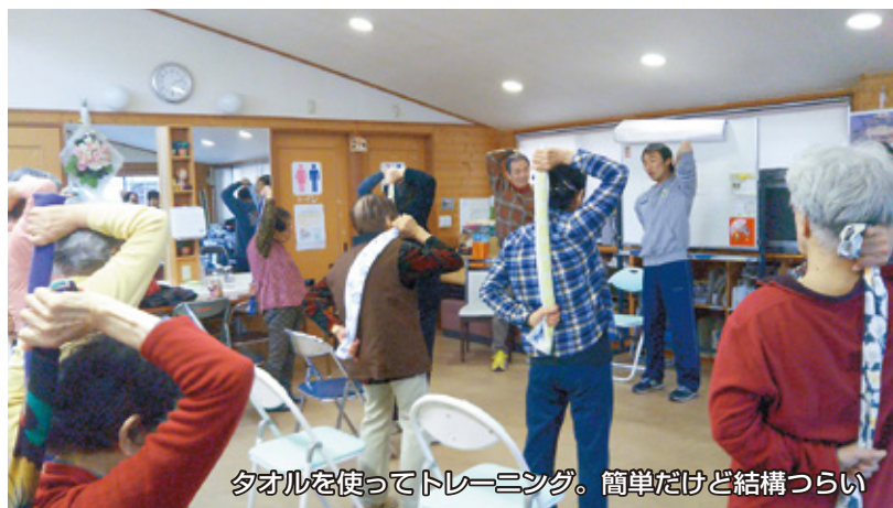
タオルを使ってトレーニング。簡単だけど結構つらい

筋力、柔軟性、骨密度などは徐々に低下していきます。特に筋力は年間1%低下していくともいわれています。